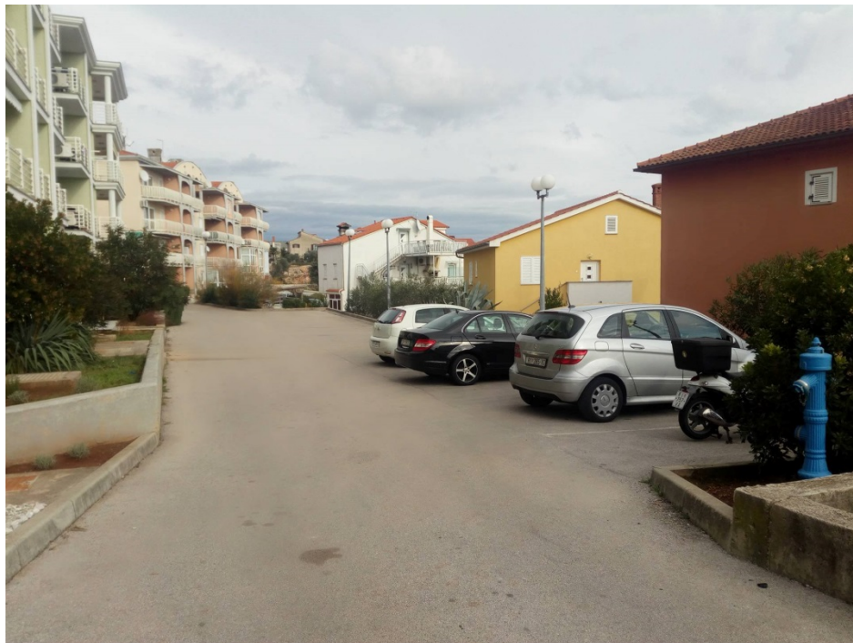
Slika 12: "Donje" parkiralište

U razgovoru sa stanarima zgrade, odgovorili su da se „donje“ parkiralište (Slika 12) može slobodno koristiti, jer oni koriste gornje.