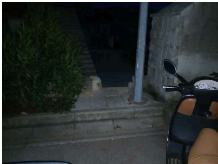
Slika 14: Stražnji ulaz "na parking" preko stubišta

Zahvaljujem na razumijevanju i molim Vas još jednom da nešto poduzmete povodom navedenih problema parkiranja u Zagrebačkoj ulici.