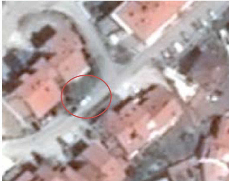
Slika 2: Prvatizacija javne površine

Obiteljska kuća kbr. 10, na javnoj gradskoj površini (Slika 2), označila je parkirna mjesta i sebi zauzela cijelu ulicu, nitko osim njih na označenim mjestima ne smije parkirati. Bave se (cijelogodišnjim) turizmom, stoga su im parkirna mjesta potrebna (kao i svima), no i ostali stanari bi morali imati pravo na pristup javnoj površini.