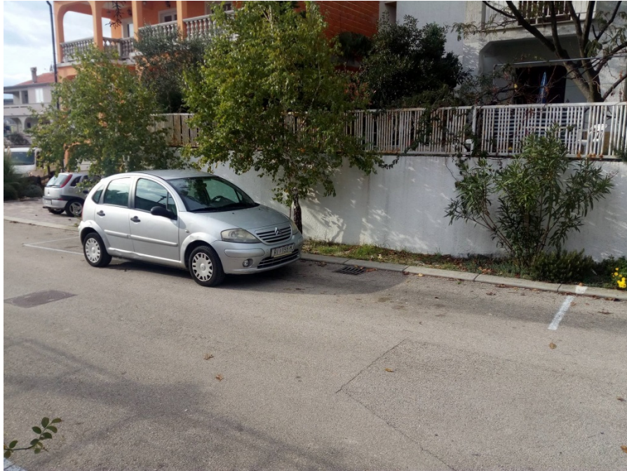
Slika 4: Parkiranje na spornim parkirnim mjestima

Za ovaj slučaj je već prethodno kontaktirano komunalno redarstvo (gosp. Vedran), koji je izvršio uvid. Naveo je da su moguća rješenja: