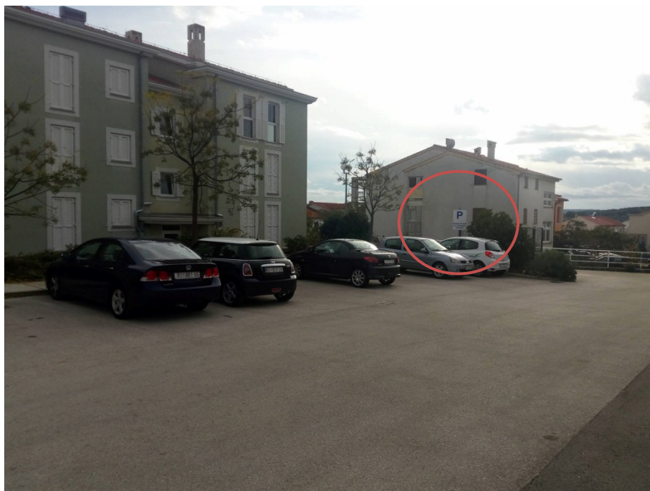
Slika 10: Gornji, gradski parking

Zbog glavnog ulaza u zgradu sa gornje strane, gradsko parkiralište navodno je dobila stambena zgrada 18ABC na korištenje od Grada, jer na ulazu stoji znak „Samo za stanare zgrade“ (Slika 10, Slika 11).