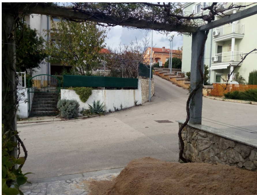
Slika 8: Raskrižje na kojem se parkira (sa donje strane)

Molim Vas da propisno označite navedeno mjesto oznakom zabane parkiranja.