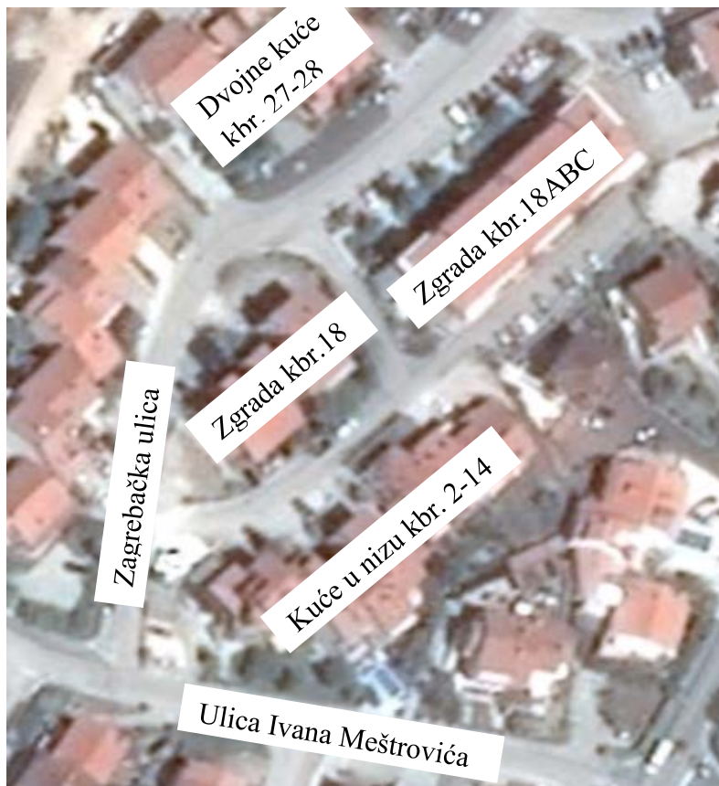
Slika 1: Raspored kuća u Zagrebačkoj ulici

U Zagrebačkoj ulici u gradu Krku, obiteljske kuće sa kbr.2-14 su poredane u nizu, dok se nasuprot nalaze dvije stambene zgrade kbr.18 i 18ABC, kao što se može vidjeti na Slika 1.