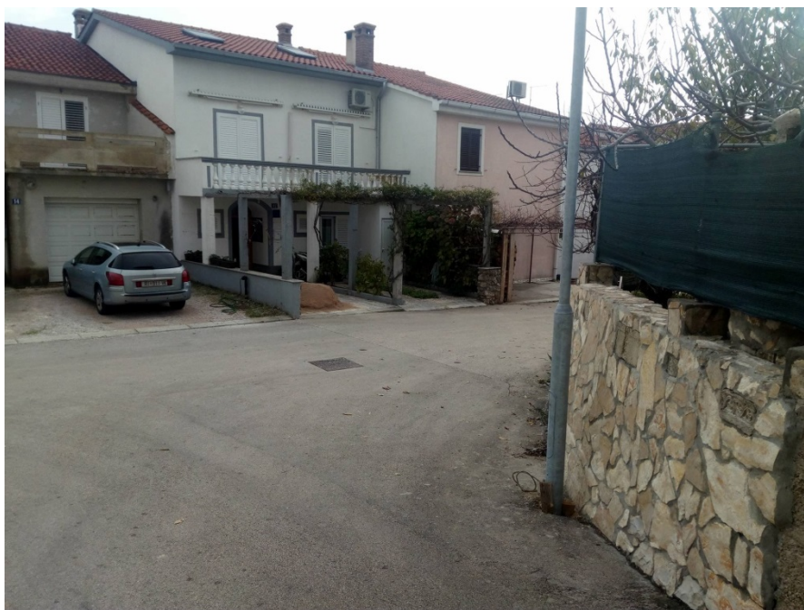
Slika 7: Raskrižje na kojem se parkira (sa gornje strane)

Na raskrižju ceste između kbr. 18 i 18ABC, na samom dnu, nema prometnog znaka zabrane parkiranja (Slika 7, Slika 8). Tijekom cijele sezone jedno vozilo je parkirano na tom mjestu.