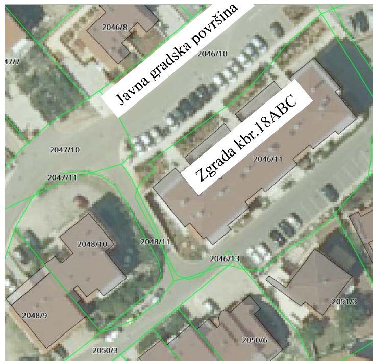
Slika 9: Katastarske čestice - geoportal državne geodetske uprave

Stambena zgrada 18ABC, prema Slika 9, posjeduje u vlasništvu parking sa donje strane, k.č. 2046/11. Sa gornje strane zgrade nalazi se javni gradski parking, k.č. 2046/10.