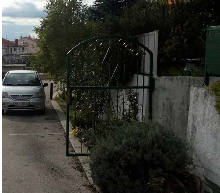
Slika 6: Otvoreni portun kbr.18 izlazi na cestu

Smatram da svatko ima pravo ograditi svoje vlasništvo, no ne na način da time ulazi na tuđi posjed ili na cestu, prilikom otvaranja portuna. Predlažem da se portun pomakne prema unutra za barem 20 cm do 50 cm kako ne bi izlazio na cestu.