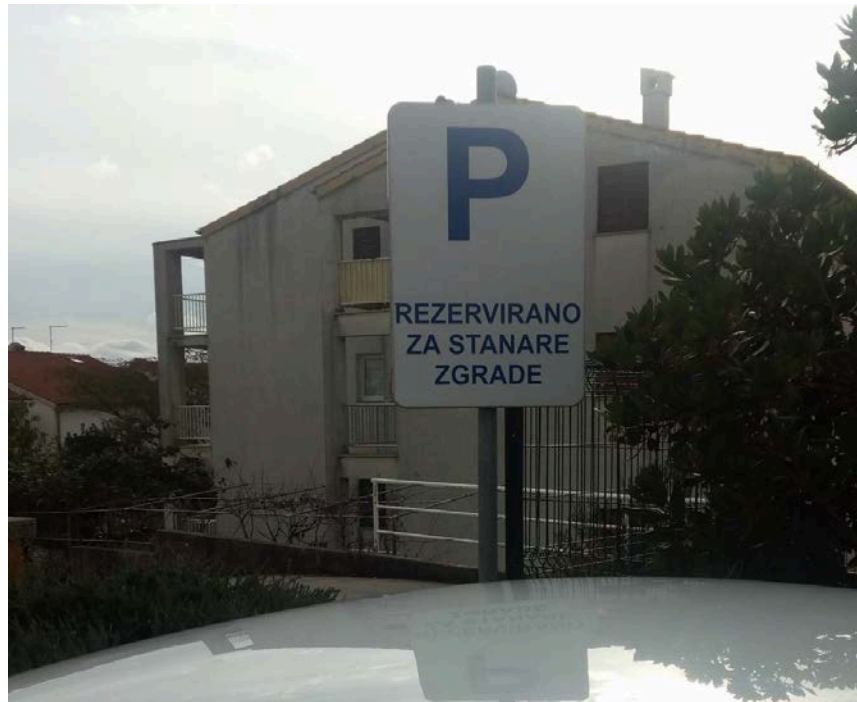
Slika 11: Oznaka "Rezervirano za stanare zgrade"

U razgovoru sa stanarima zgrade, odgovorili su da se „donje“ parkiralište (Slika 12) može slobodno koristiti, jer oni koriste gornje.