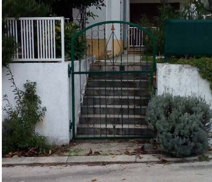
Slika 5: Portun od zgrade kbr. 18

Stanari zgrade kbr. 18 imaju ulaz na cestu preko stubišta. Samoinicijativno su svoj ulaz ogradili metalnim portunom duljine 1.20m, koji se zbog nemogućnosti otvaranja prema unutra, otvara prema cesti. Kada se otvore, vrata ulaze na cestu cca. 20 cm kao što se vidi na Slika 5, Slika 6.